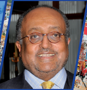
Afrika, Zukunftsmarkt Dr. Asfa-Wossen Asseerate, Prinz und Berater

Das Wirtschaftsmagazin der Baubranche Jetzt abonnieren!